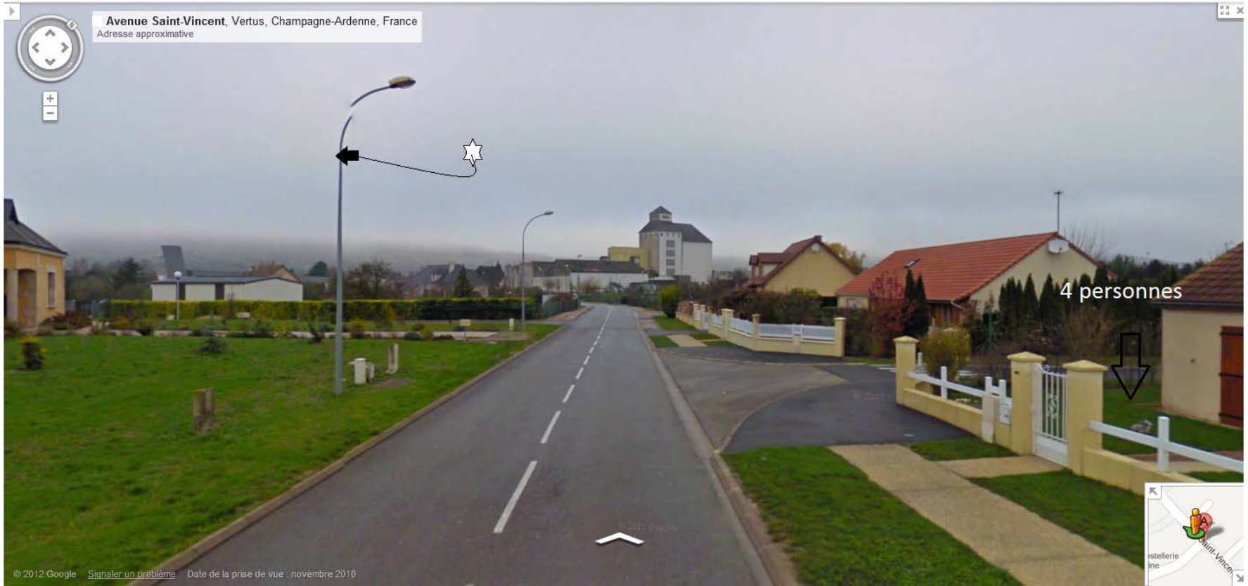
4.2. Plan de l'environnement, de vos positions et directions d'observation du phénomène