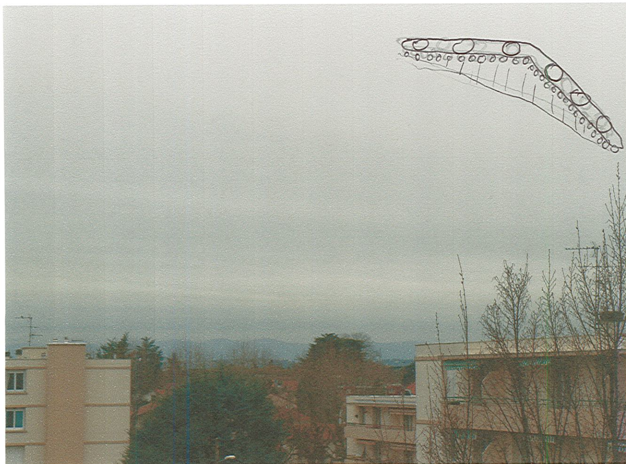
Vue de la fenêtre de ma cuisine