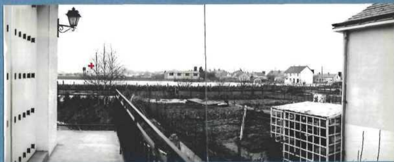
2 - Première apparition + Localisation de l'apparition, située à l' du point d'observation n° 1.