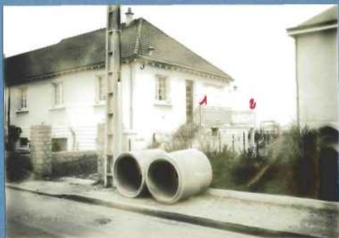
1 - 1 - premier point d'observation 2 - second point d'observation