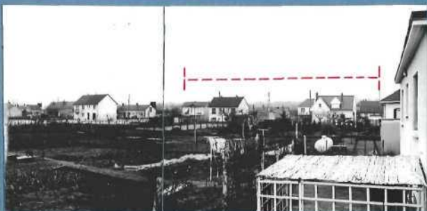
3 - Seconde apparition -> Localisation de l'apparition, située au du point d'observation n° 2.