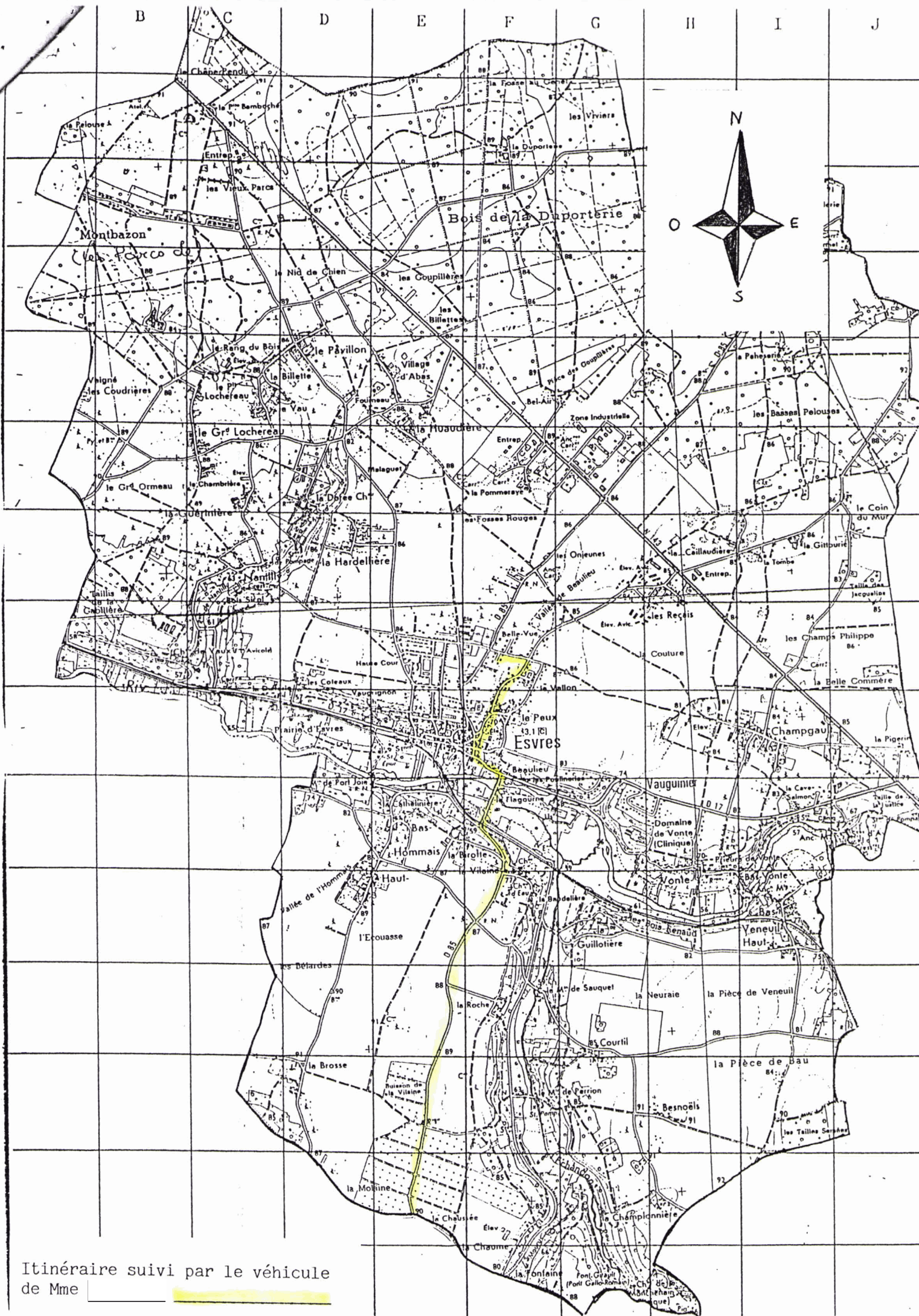
Itinéraire suivi par le véhicule de Mme