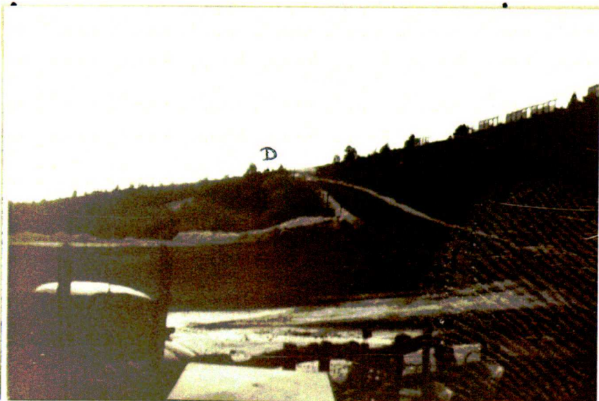
CLICHE n° IV :

Vue prise du poste d'observation des militaire dans la direction de la table d'orientation (B) et de la tour hertzienn (C)