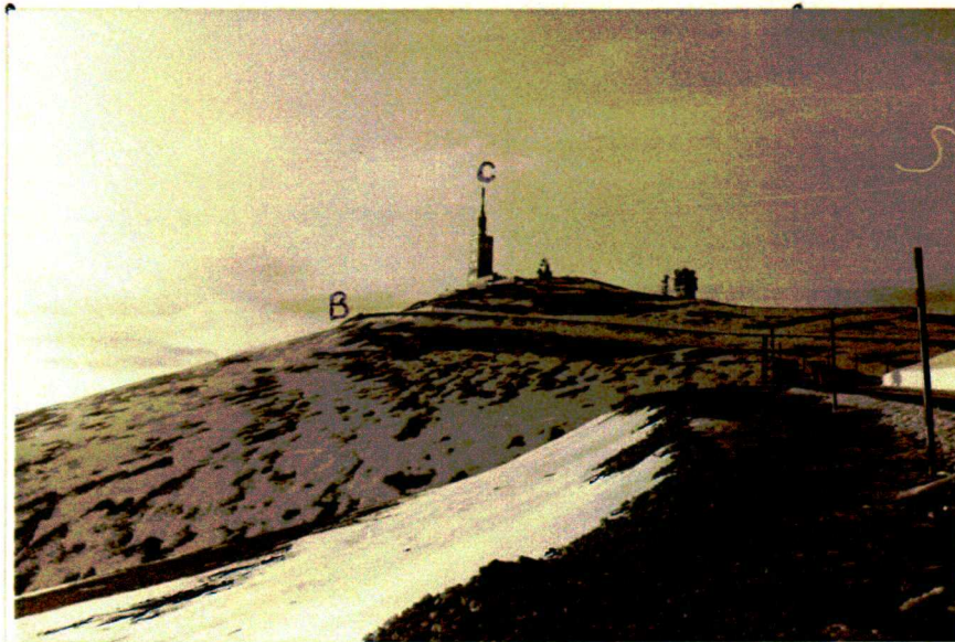
CLICHE n° I :