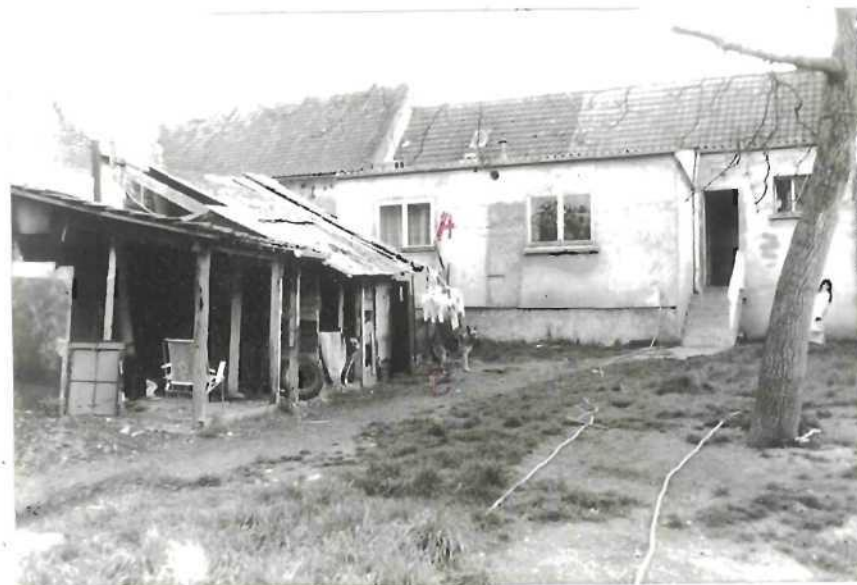
CLICHE N° 2:

Vue générale des lieux prise à 200 mètres du point d'observation. Aucune trace n'est visible.