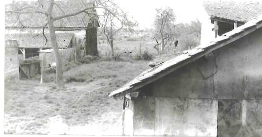
CLICHE N° 4:

Vue intérieure de la fenêtre par laquelle la lumière a pénétré dans la chambre. Au premier plan, emplacement du lit de C, D. Au second plan, position du lit de sa jeune nièce V, par rapport à la fenêtre.