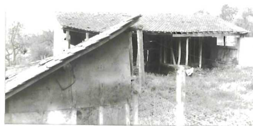
CLICHE N° 5:

Vue prise depuis la fenêtre de la chambre de C, D. Aucune trace n'a été laissée dans la cour intérieure de l'habitation ni parmi la végétation.