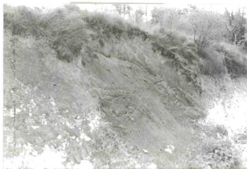
CLICHE N° 6:

Vue de la propriété voisine prise depuis la fenêtre. Aucune trace n'est visible.