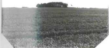
Vue générale du bosquet. Endroit où l'O.V.N.I. a été susceptible de se poser. Au premier plan, champ de céré ales.