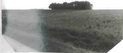
Vue générale du bosquet prise sous un angle différent. O.V.N.I. susceptible de s'ê tre posé derrière ce petit bois.