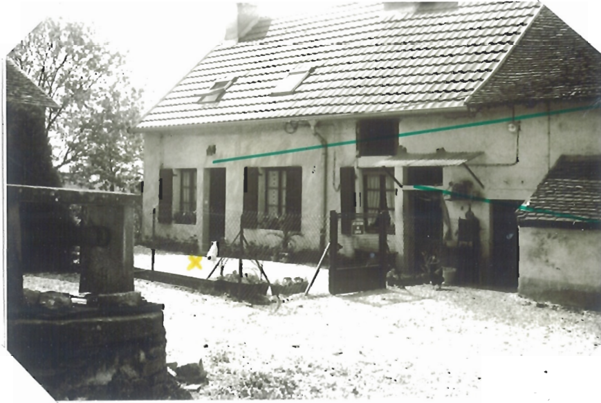
Photographie n° 1