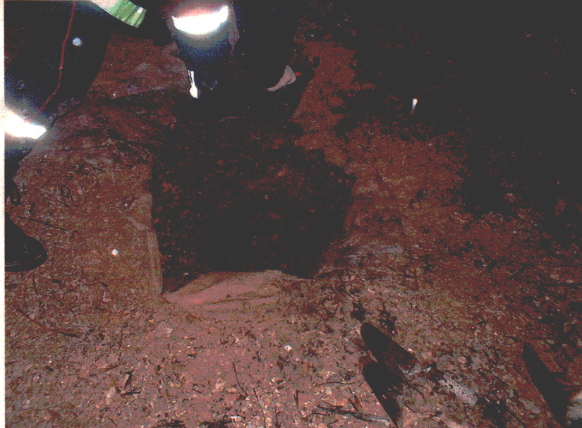
Photo n° 02 : Vue orifice après interventions des sapeurs pompiers.