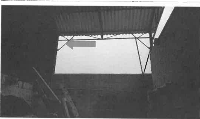
Localisation du 1 er objet aperçu par Monsieur

Ce dernier nous amène à l'emplacement où il se trouvait quand il a aperçu les objets non identifiés dans le ciel. Nous réalisons deux clichés photographiques.