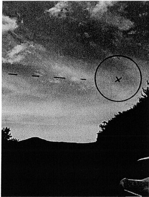
(cliché du 14.11.09)