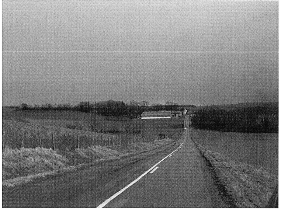
Vue générale du bâtiment agricole où a été observé le phénomène.