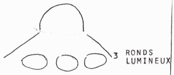
FORME DE L'O V N I VUE PAR CETTE AUTOMOBILISTE