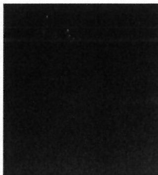
Au-dessus du toit, la photo laisse entrevoir les points lumineux aperçus.

Une jeune femme est parvenue à prendre les points lumineux en photo : « Mon ami, qui regardait par la fenêtre, a vu tout à coup apparaître ces 10 ou 12 lumières, témoigne-t-elle. Une partie d'entre elles était en cercle, et une autre, placée sur l'arrière. Les lumières étaient plus ou moins fixes, avec des faisceaux virant sur le bleu. Il n'y avait pas de bruits particuliers. » Le couple a aussi saisi le phénomène sur une vidéo, mais dont les images sombres ne sont guère