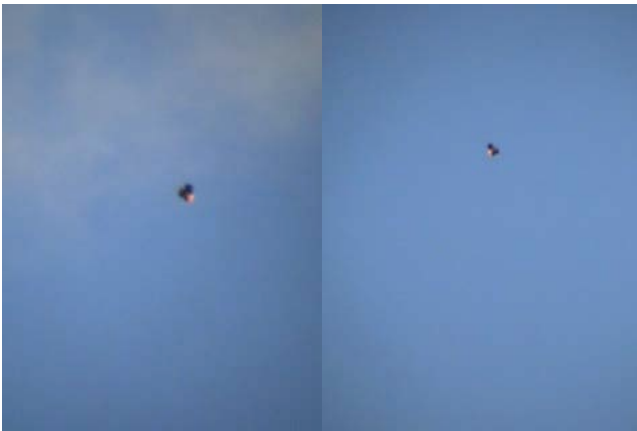
Images extraites entre 4'39" et 4'42" (à gauche) et entre 5'33" et 5'35" (à droite). Ces deux dernières ont été redressées afin de présenter l'objet sous son apparence la plus connue.

Les dernières images ne révèlent rien de plus, mais confirment la parenté de l'objet avec un célèbre personnage de Walt Disney :